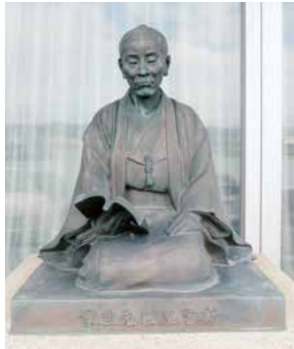
📖 書物を読む涼庭のどうぞう