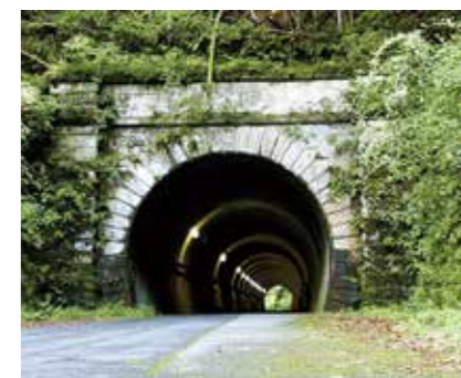
➡ 旧栗田トンネル（撥雲洞トンネル）