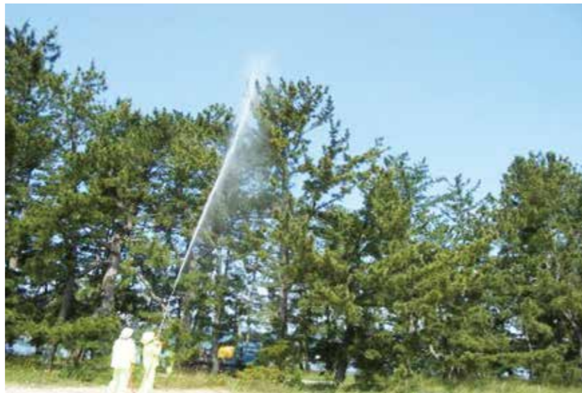
松がれをふせぐ薬をまく様子