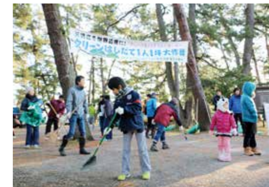
地いきボランティアの活動