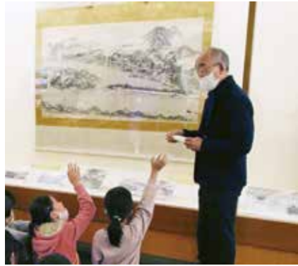
雪舟「天橋立図」(京都国立博物館蔵) 2020年、京都府立丹後郷土資料館に 約40年ぶりにてんじされたときの様 子です。