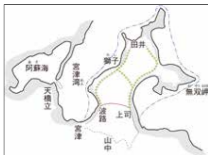
➡ 栗田から宮津への道