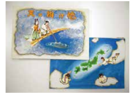
「天の掛け橋」(みやづ昔話紙しばい)

このお話は、1994(平成6)年に市政40周年を記念してつくられた紙しばいです。それぞれの学校の図書館にもあるので、ぜひ続きを読んでみましょう。また、ほかにも天橋立についてのお話がないか、調べてみましょう。