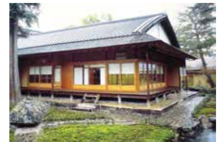
📍 今の「順正」（もと順正書院）今は、湯どうぶや京料理を味わう料理店「順正」としてにぎわっています。