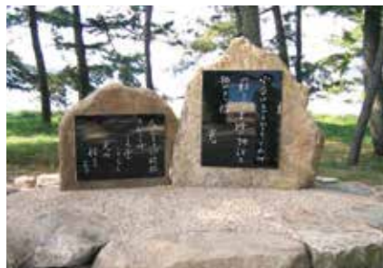
与謝野寛と妻の与謝野晶子の歌ひ