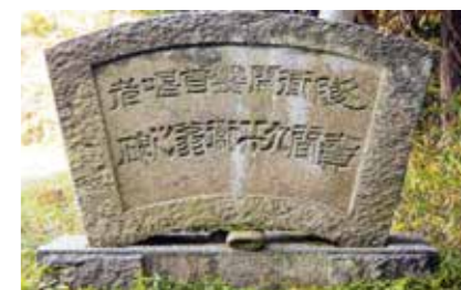
➡ 売間九兵衛の石ひ