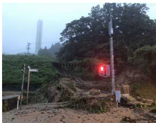
平成 30 年 西日本豪雨 平成 30 年 7 月 5 日～9 日 (池ノ谷地区の土砂崩れ) (京都丹後鉄道宮舞線の崩落)