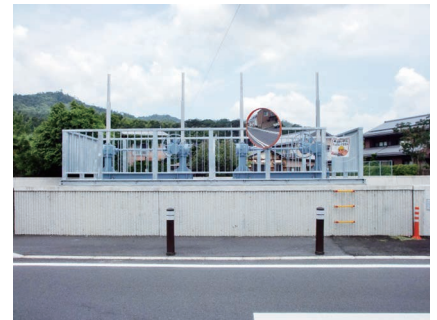
辻川樋門（宮津小学校グラウンド 前） 大手川の水位が高くなったとき に水があふれるのをふせぐ門です。