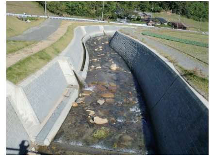
ていぼうが整いされた大手川上流