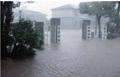
⬆️水につかった宮津小学校旧正門 きゅうせいもん