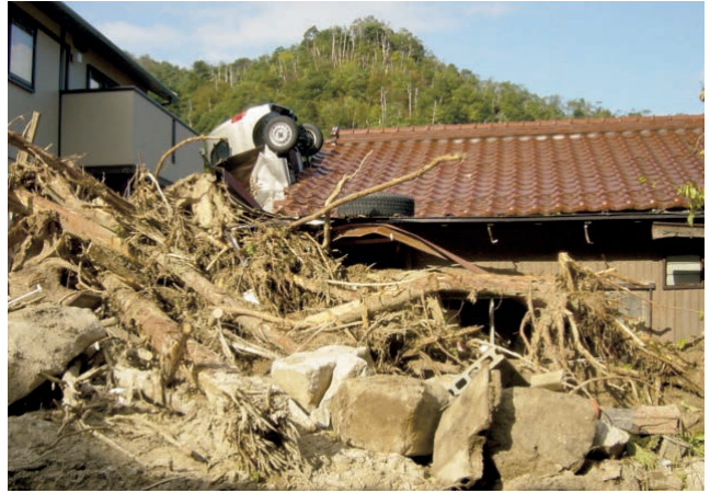
⬆️台風 23 号による土砂災害 (2004 年)