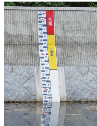
大手川の水量をしめす標 しき（京口橋）

このほかに学校や通学路などで、自然災害 にそなえたものがあるか調べてみましょう。