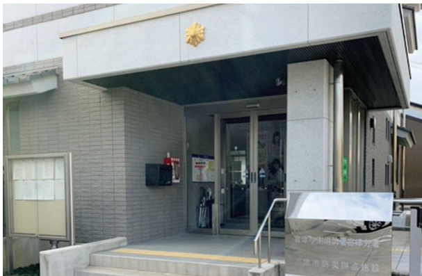
宮津市防災きょしせつ