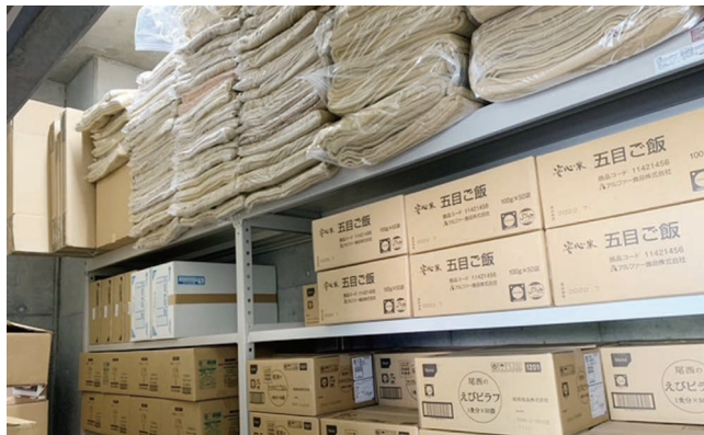
びちく倉庫にほかんされている食料や毛布