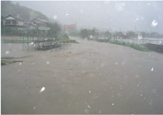
⬆️台風 23 号による大手川のはんらん (2004 年)