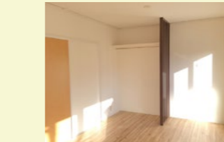
備え付けのハンガーラックで「見せる収納」