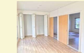
光が差し込む開放的な間取り