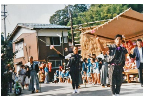
大西集落の太刀振り