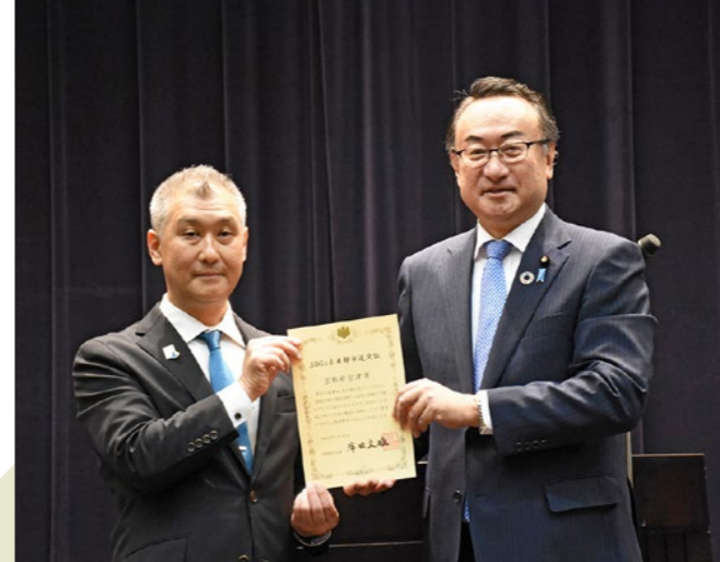
▲ SDGs 未来都市選定証授与式（5月22日）が内閣府で行われ、 あかた 岡田地方創生担当大臣から選定証が授与されました。