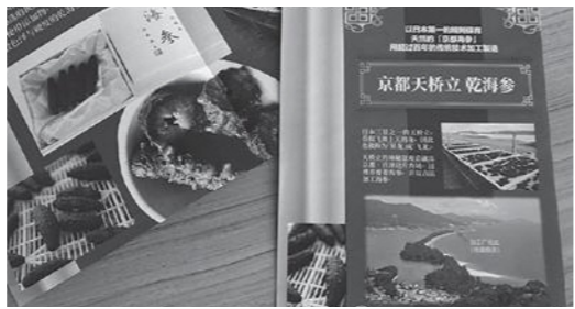
中国語なまこパンフレット