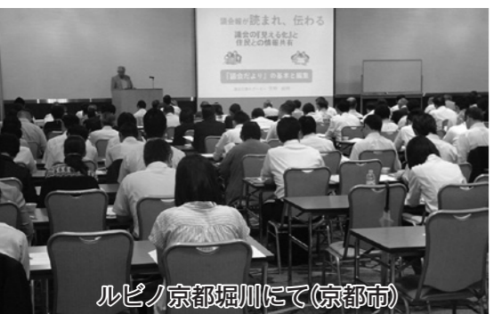
ルピノ京都堀川にて(京都市)

この研修会には、宮津市の議員のほか、北部4市2町の議員を招き、約120人の参加がありました。