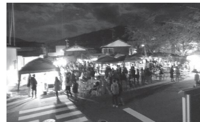
亀ヶ丘児童遊園の飲食ブース