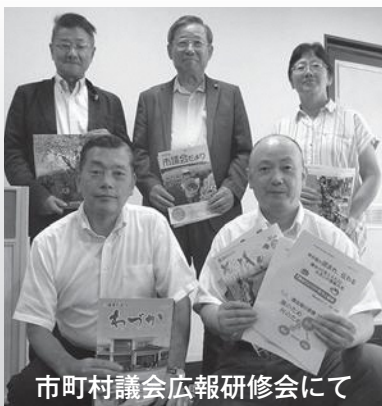
市町村議会広報研修会にて