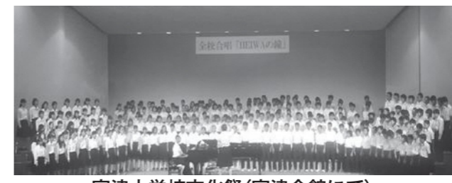
宮津中学校文化祭(宮津会館にて)