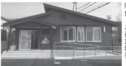
栗田のびのび放課後児童クラブ