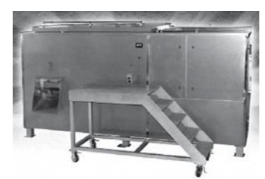
有害鳥獣処理システム

A 衛生面では、病原菌は空気感染しないため、地域住民に影響はない。作業員は防護服を着用することなどから問題ない。安全対策として、施設し、フェンスを設置する他、北部施設は機械警備を考えている。