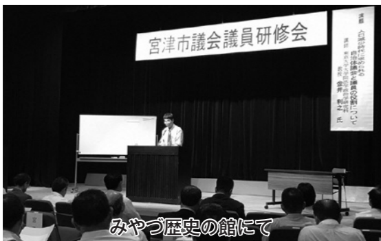
みやづ歴史の館にて

○ 議会だよりは住民が読むものである。読みやすく、わかりやすく住民目線に立ち、一方通行ではなく双方向性の紙面づくりを追求していきたい。 ○ 論評②に示されている点を改善し「読みたいなる紙面づくり」を心がけていきたい。