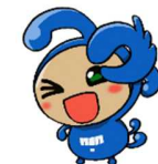
宮津市マスコットキャラクター なみちゃん

“みやづ”をフィールドにSDGs（持続可能な開発目標）の取り組みをより一層進めていこうとする 企業・団体・学校・個人等 を みやづSDGsプラットフォーム 会員として募集します。