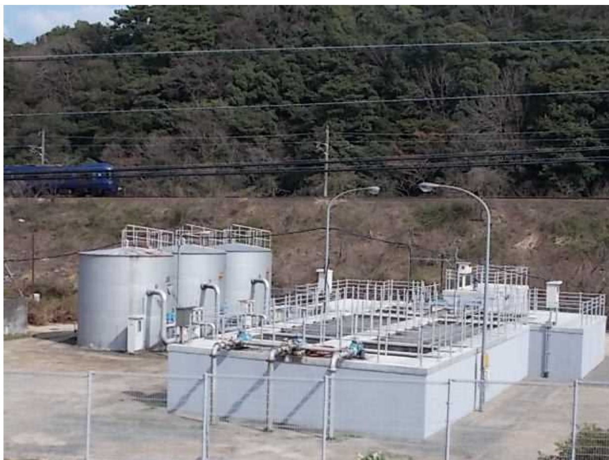
上宮津浄水場改修工事(令和3年度浄水施設耐震化)