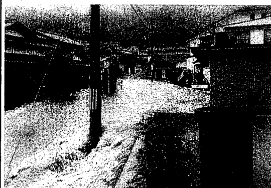
H30. 7月豪雨の被災状況