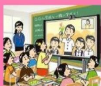
C4 学校の壁を越えた学習

◆小中一貫教育の独自の教育課程「ふるさとみやづ学」などにおいて、ICTを活用した協働での意見整理や学校間の交流授業等を増やしていきます。また、海外の姉妹都市とのリモート交流なども行っていきます。