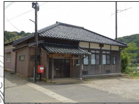
田原公民館（一時避難所）