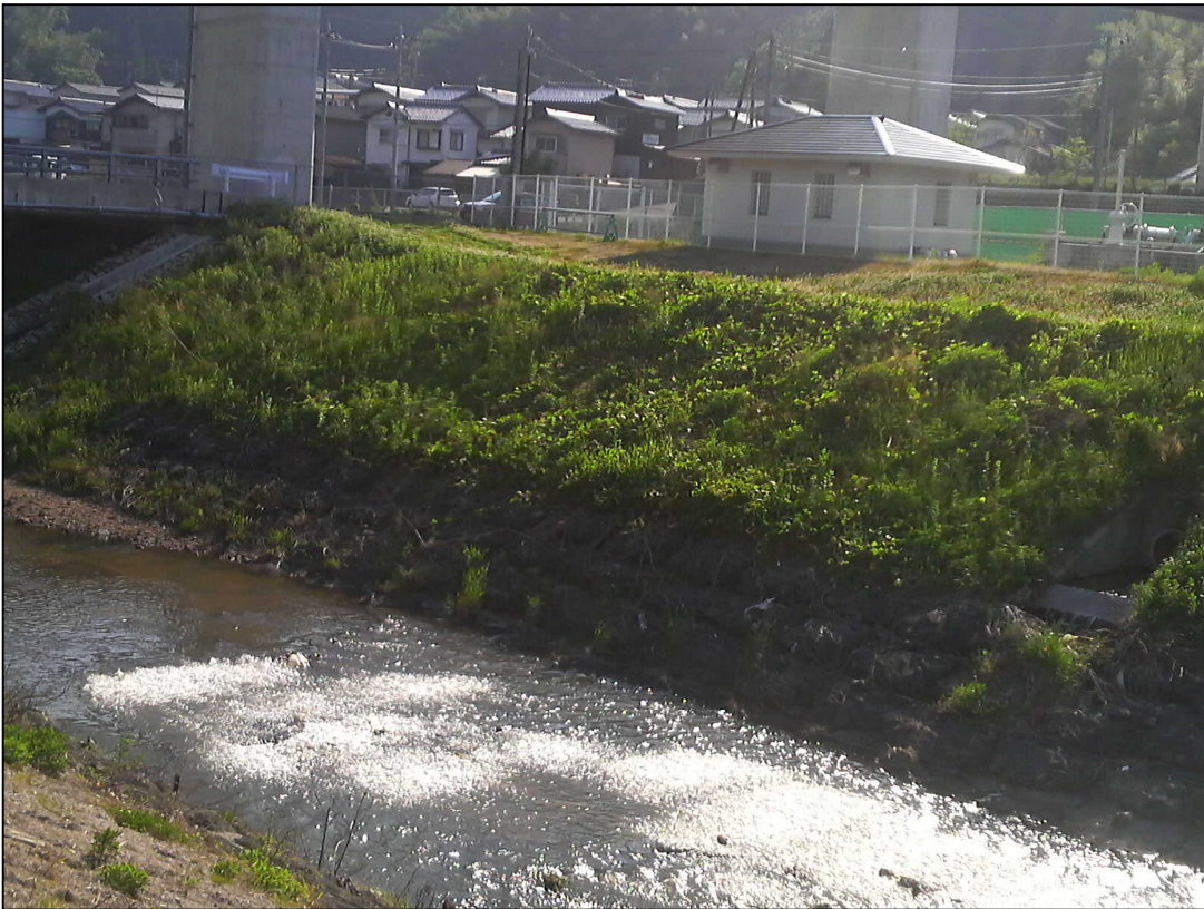
喜多取水場（逆洗状況）