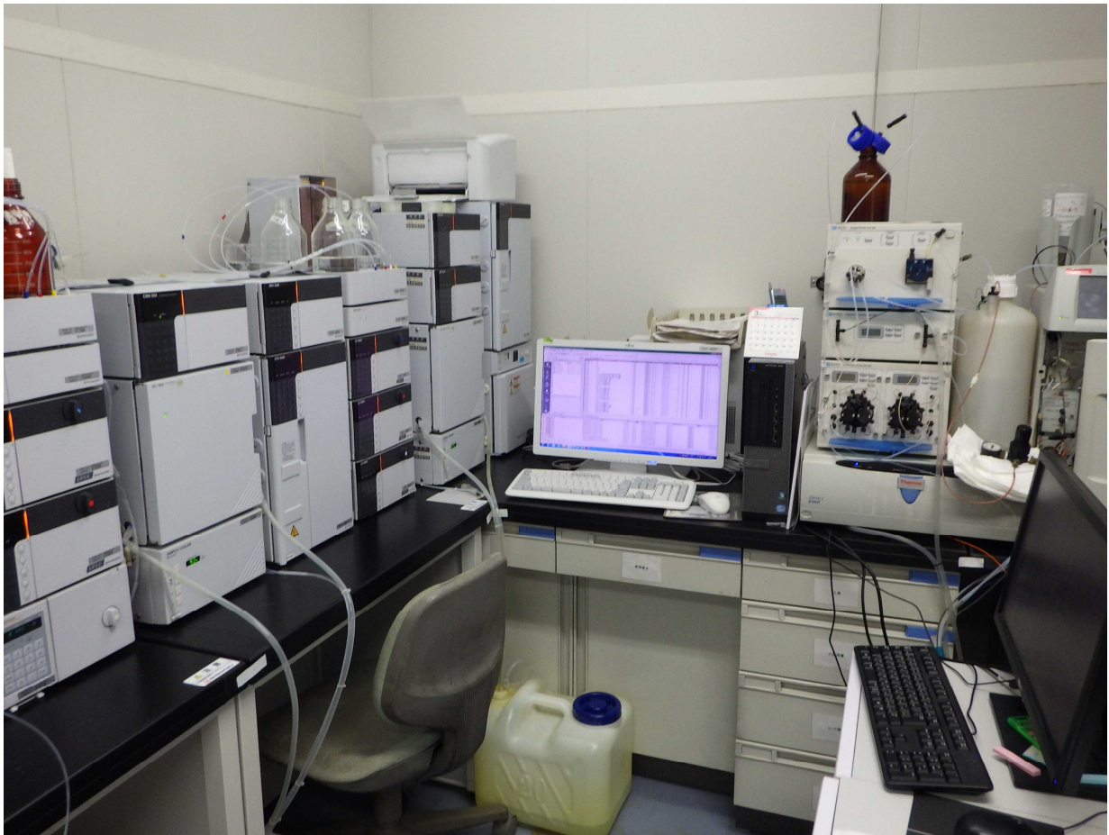
水質検査機器：イオンクロマトグラフ