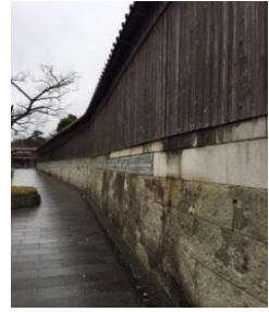
船主達が築いた町（加賀市）

解放を与えた花街や、日和を見た小高い山、航海の安全を祈った神社仏閣など、北前船がもたらした機能が整えられています。そこには、封建下にあつて近隣の稲作を中心とした農村や、その基盤上にある城下には見られない、海上輸送という手段を手にした商人たちの築いた町があります。想像もできないほど高い塀や、敷地内に多くの土蔵を持つ豪壮な屋敷を見て、「こんな所になぜ、こんな大きなお屋敷が」と言った、驚きや発見に出会うことができます。