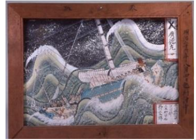
危険な航海の様子（加賀市）

熟練の操船技術を持つ船乗りにとっても、嵐にあえば「板子一枚下は地獄」の恐怖にさらされます。商品を無事に運べば多額の利益を得られる北前船も沈んでしまえば一巻の終わり、全財産を失う船主もいました。危険と隣り合わせの航海は、安全を神仏の庇護に求め、寄港地の中心や小高い丘には神社や寺院があり、港と並行に寺院が建ち並ぶ町もあります。ここでは、航海の無事を祈願した船絵馬や船模型、中にはちょんまげを奉納した