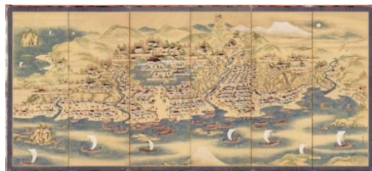
当時の町の賑わい (松前町)

もう一つは、山と海の間のおずかな平坦地に位置する「山に抱かれる」港です。一度の航海で巨万の富が得られる北前船が頻繁に行き交うようになると、風待ち港も含め多くの寄港地が整備されました。砂丘の多い日本海沿岸では、山と海に挟まれたわずかな平坦地を利用し、コンパクトな港や集落を築いています。古い建物や荷揚場、船止めの杭など、北前船によりもたらされた、文化遺産が集約された町並を歩いて回ることができます。