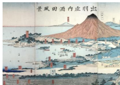
山を仰ぐ港 (酒田市)

一つは、山を借景として大きな川の河口に位置する「山を仰ぐ」港です。日本海から仰ぐ名山は、古くから航海の目印となり、その近くに港を築いています。これらの港は江戸時代には、上方への年貢米の積出港となり、領内の穀倉地帯を流れる大河の河口に米倉、番所などが整備されました。名山を仰ぎ大河に抱かれる港が、日本海を經由し