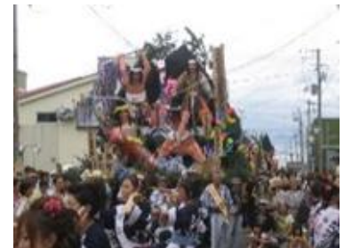
今でも賑わう港の祭り（秋田市）

北前船は生活必需品に加え、雛人形などの高級品、そして様々な文化を運んでいます。天候に左右される北前船の航海は、「風待ち」という文化により、出港までの間、料亭や茶屋などでの一時の出会いと別れと共に、そこで唄われる民謡など各地の芸能が船乗りたちによって伝わっていききました。代表的なのが、「おけさ」や「あいや節」などと呼ばれる哀調を