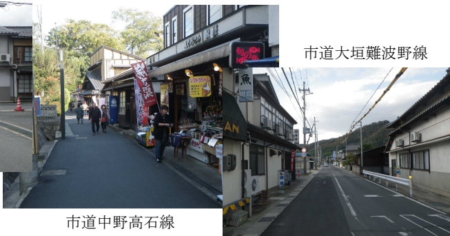
市道大垣難波野線