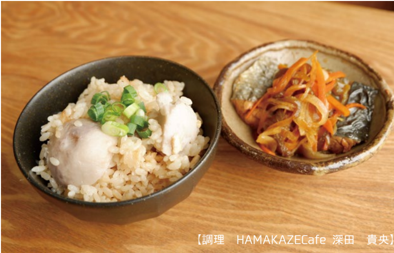
【調理 HAMAKAZE Cafe 深田 貴央】