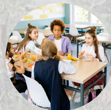
外国の人と関わる