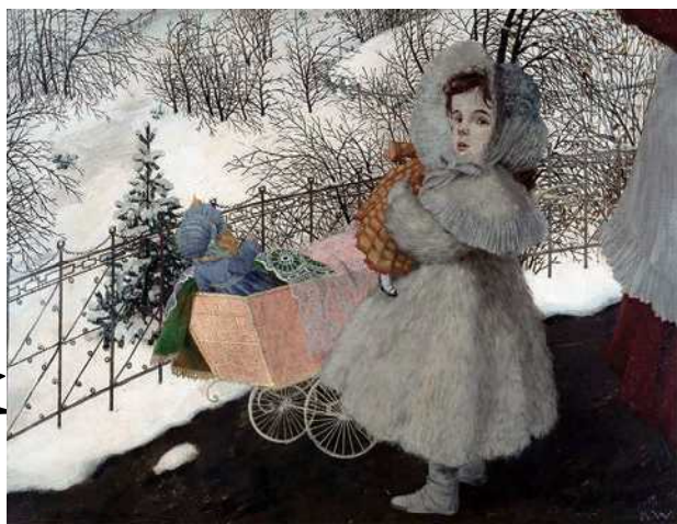
《人形の乳母車と少女》 1905年以前 新ビール美術館

は、近年その再評価が始まっています。知名度のかなり低い画家と言っているだけでいいでしょう。1877年に、スイスのベルン近郊にあるビールで生まれたカール・ヴァルザー(1877-1943)は、シュトラスブルク(*1)の美術工芸学校で学んだ後、1899年にベルリンに移りました。1902年に、伝統的で保守的な芸術からの脱却を目指すベルリン分離派(*2)の展覧会に初出品し、翌年には会員になります。この時期の鮮烈でありながら神秘的な作品群