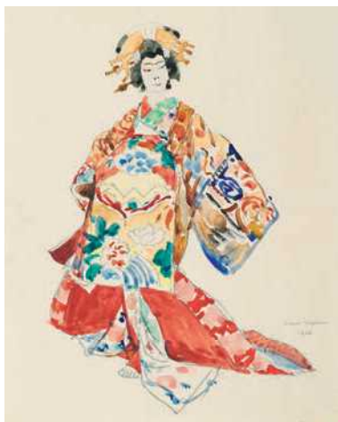
《歌舞伎の女形(《歌舞伎の一場面》のための習作)》 1908年 ベルン美術館(友の会) ©Kunstmuseum Bern

4月から約半年に及ぶ滞在期間中に2人は日本各地を巡りますが、大いに気に入って長逗留したのが宮津(京都府)でした。ヴァルザーはこの街で、芸妓や舞妓、歌舞伎役者や市井の人々の姿を、生き生きとした筆致と美しい水彩で描きとめています。京都では風景や祭を油彩で描き、重厚な作品に仕上げました。