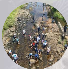
山、川で遊ぶ・学ぶ