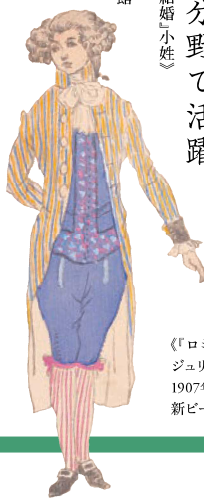
『ロミオとジュリエット』乳母』 1907年 新ビール美術館