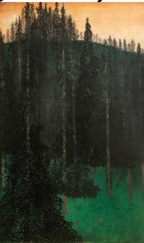
《森》 1902-03年 新ビール美術館