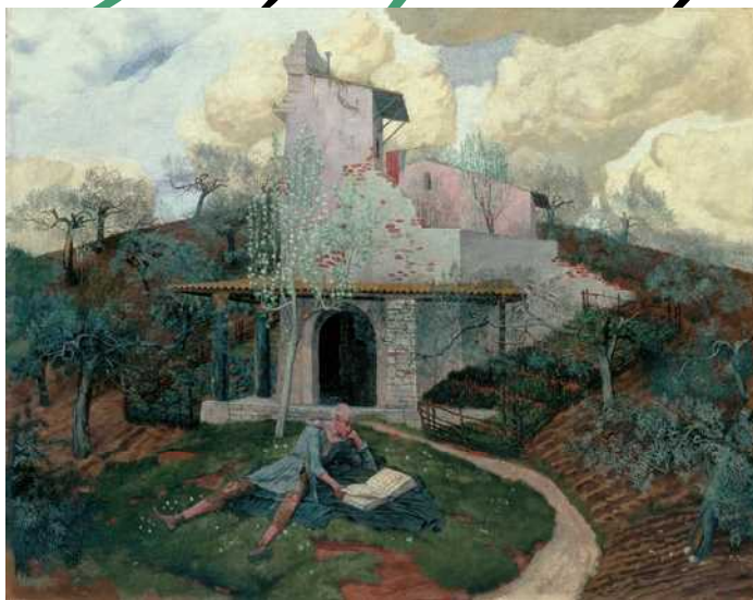
《隠者》 1907年 チューリヒ美術館