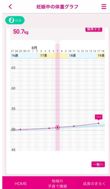
例：妊娠中の体重グラフ