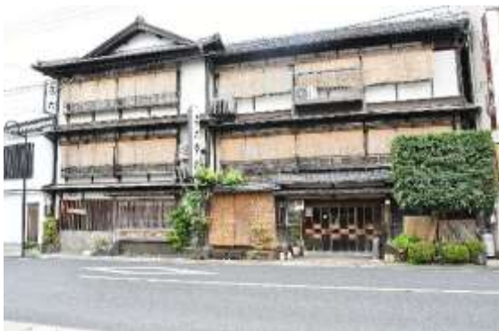
西堀川通り・茶六本館