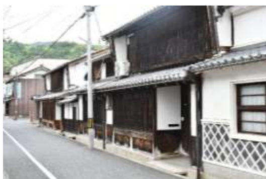
万町通り・今林家住宅（天満宮鳥居 東から）