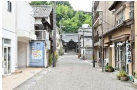
西堀川通り・佛性寺山門(本町交差点 北から)