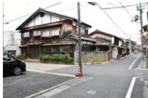
万町通り（西堀川交差点 西から）