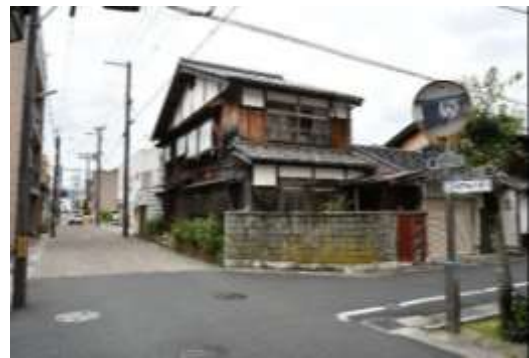
西堀川通り(万町交差点 南から)