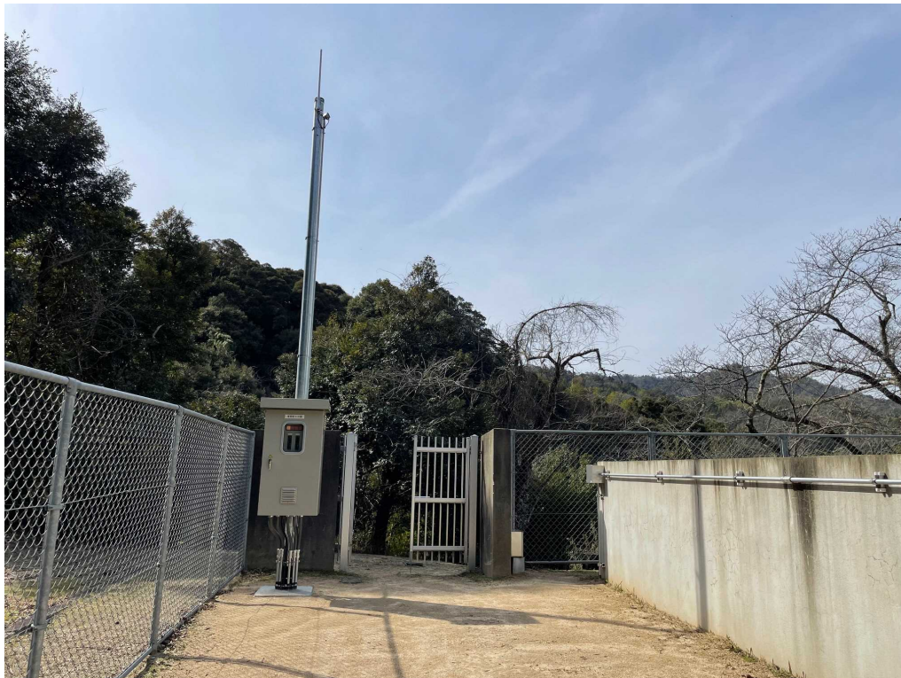
滝馬配水池無線装置設置