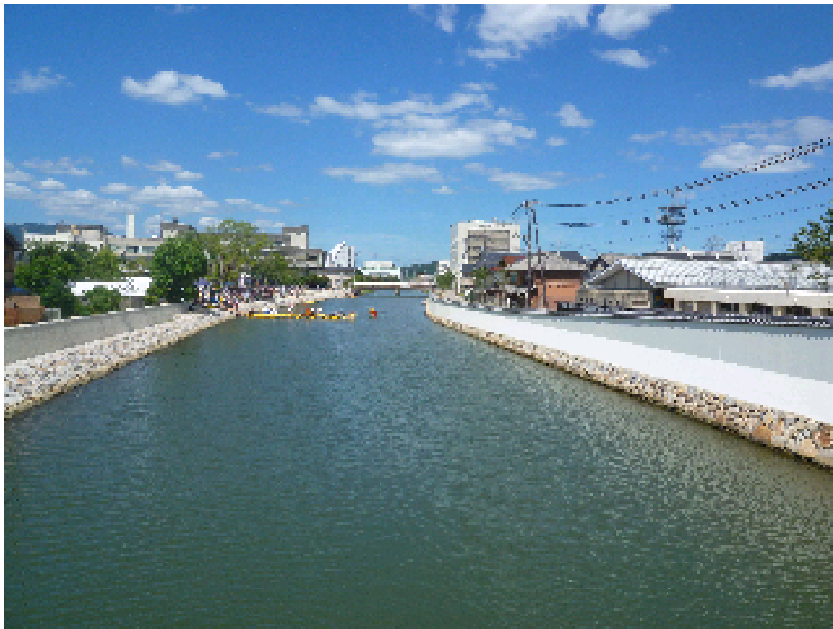
平成23年3月 大手川河川竣工