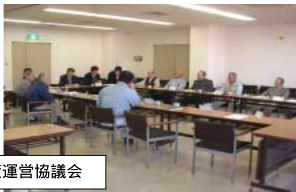
宮津市野生鳥獣被害対策運営協議会