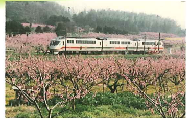
沿線を「花のトンネル」に..