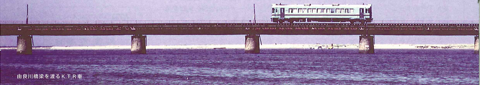
由良川橋梁を渡るKTR車