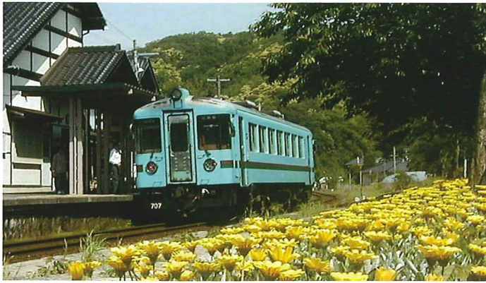
駅構内を「花の駅」に..

駅と駅周辺に美しい環境をつくり、 情緒ある癒しの空間を創造します。 丹後を訪れたかたに、 四季折々の花を楽しんでいただきます。