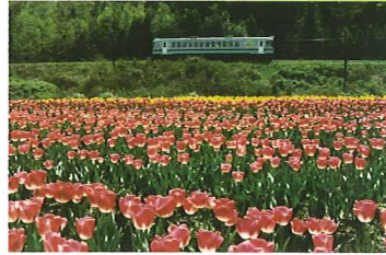
駅周辺を「花の名所」に..

駅と駅周辺に美しい環境をつくり、 情緒ある癒しの空間を創造します。 丹後を訪れたかたに、 四季折々の花を楽しんでいただきます。