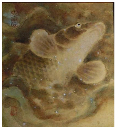
昭和五年(一九三〇)父の死亡により、家業の菓子製造を守るため帰郷する。

昭和五年(一九三〇)父の死亡により、家業の菓子製造を守るため帰郷する。 (奥谷 安弘)