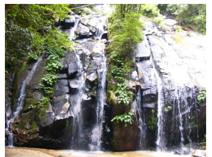
日本の滝百選(京都府で唯一) 金引きの滝

この景色を見たとき、これはこのままでは勿体ない、是非いろんな人に見てもらったら多くの人が感動するだろうと、市役所の商工観光課の人たちとも二十三年に歩いた。十一月にツアーが実現