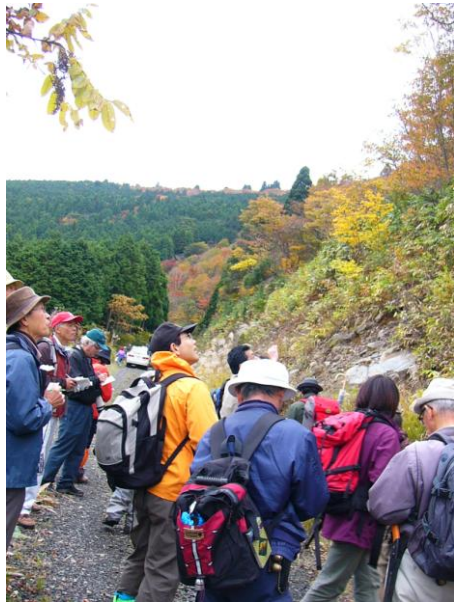
杉山で勉強中のエコツアーガイド ★植物・動物・地質・歴史・文化など「地域の宝を丸ごと」学びます

カラン岩はカンラン石を主体とした黒色の岩石ですが、地下での熱水的作用によって蛇紋岩に変化しています。この蛇紋岩は緑から青味を帯びて表面がツルツルした感じになります。宮津では蛇紋岩を庭石や石垣に使ったお宅を見かけることがあります。また普甲峠を南に下った中の茶屋では、鉱物が繊維状になった珍しい深緑色の繊維状蛇紋岩が見られ、大江山スキー場のリフト乗り場付近には、輝石からなる輝石岩も見られます。地元では見慣れたカラン岩(蛇紋岩)は、実は珍しい岩石なのです。 大江山の岩石が貴重なもう一つの理由は、その岩石が出来た時代です。大江山の岩石は地下深くで出ません。以前から古い時代とは考えられてきました。近年、放射性同位元素を用いた測定で、約四億七千万年前(古生代オルドビス紀)であることが明らかになりました。日本列島の岩石の中では、非常に古いものなのです。この時代は、まだ日本列島はなく、生物の多くは海中で生活していたと考えられています。大江山のこの岩石は近畿地方では最も古い岩石と言えます。