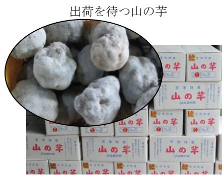
出荷を待つ山の芋