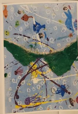
Japan Miyazu Bay