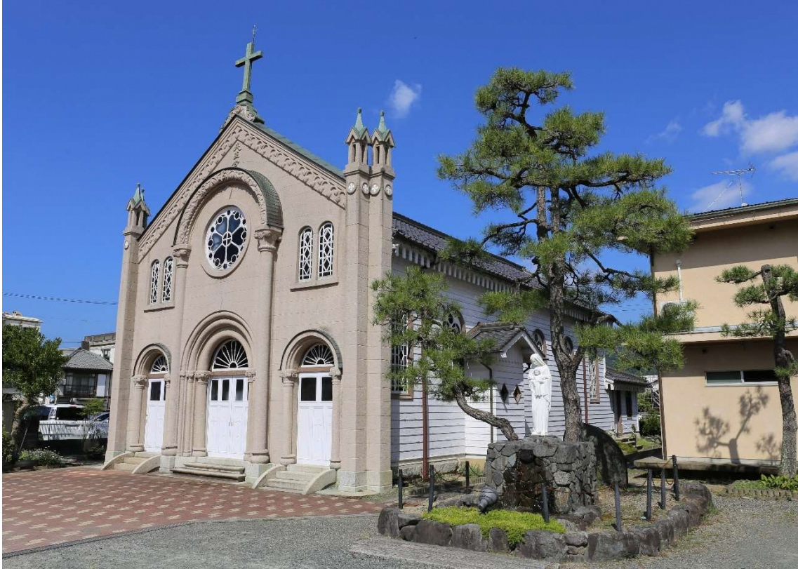
宮津洗者聖若翰天主堂 外観